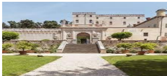
CASTELLO DEL CATAJO

MATTINO : Visita guidata al CASTELLO DEL CATAJO. Percorso alla scoperta della “ Reggia dei colli Euganei ” edificata a partire dagli anni ‘70 del 500 dalla famiglia Odizzi e dei magnifici saloni del suo Piano Nobile per proseguire poi con la visita dell’Oratorio di San Michele ovvero la “Cappellina Imperiale” costruita per la visita dell’Imperatore d’Austria nel 1838.